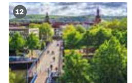
ZDF-Landesstudio Saarland Franz-Mai-Straße 1 66121 Saarbrücken