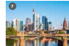
ZDF-Landesstudio Hessen Murnastraße 6 65189 Wiesbaden