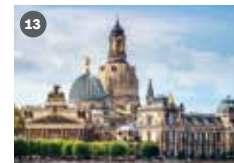
ZDF-Landesstudio Sachsen Königstraße 5a 01097 Dresden