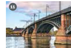
ZDF-Landesstudio Rheinland-Pfalz ZDF-Straße 1 55127 Mainz