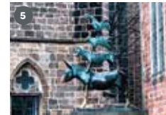
ZDF-Landesstudio Bremen Hinter der Mauer 5 28195 Bremen