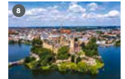
ZDF-Landesstudio Mecklenburg-Vorpommern Friedrichstraße 2 19055 Schwerin