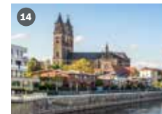
ZDF-Landesstudio Sachsen-Anhalt Einsteinstraße 15 39104 Magdeburg