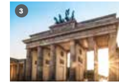
ZDF-Landesstudio und ZDF-Hauptstadtstudio Berlin Unter den Linden 36-38 10117 Berlin