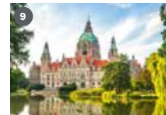
ZDF-Landesstudio Niedersachsen Wiesenstraße 56 30169 Hannover