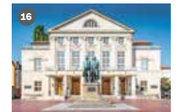
ZDF-Landesstudio Thüringen Marktstraße 50 99084 Erfurt