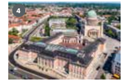
ZDF-Landesstudio Brandenburg August-Bebel-Straße 15 14482 Potsdam