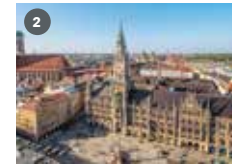
ZDF-Landesstudio Bayern ZDF-Straße 1 85774 Unterföhring