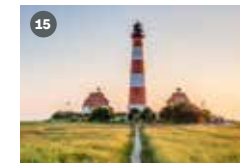
ZDF-Landesstudio Schleswig-Holstein Am Wall 68 24103 Kiel