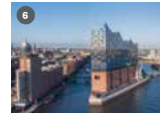
ZDF-Landesstudio Hamburg Oberbaumbrücke 1 20457 Hamburg